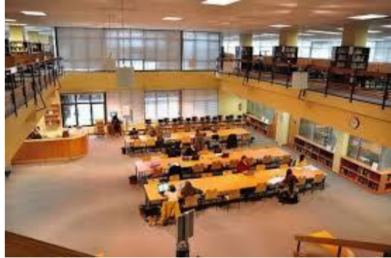
Vista principal de la sala de lectura de la planta baja Facultad de Psicología