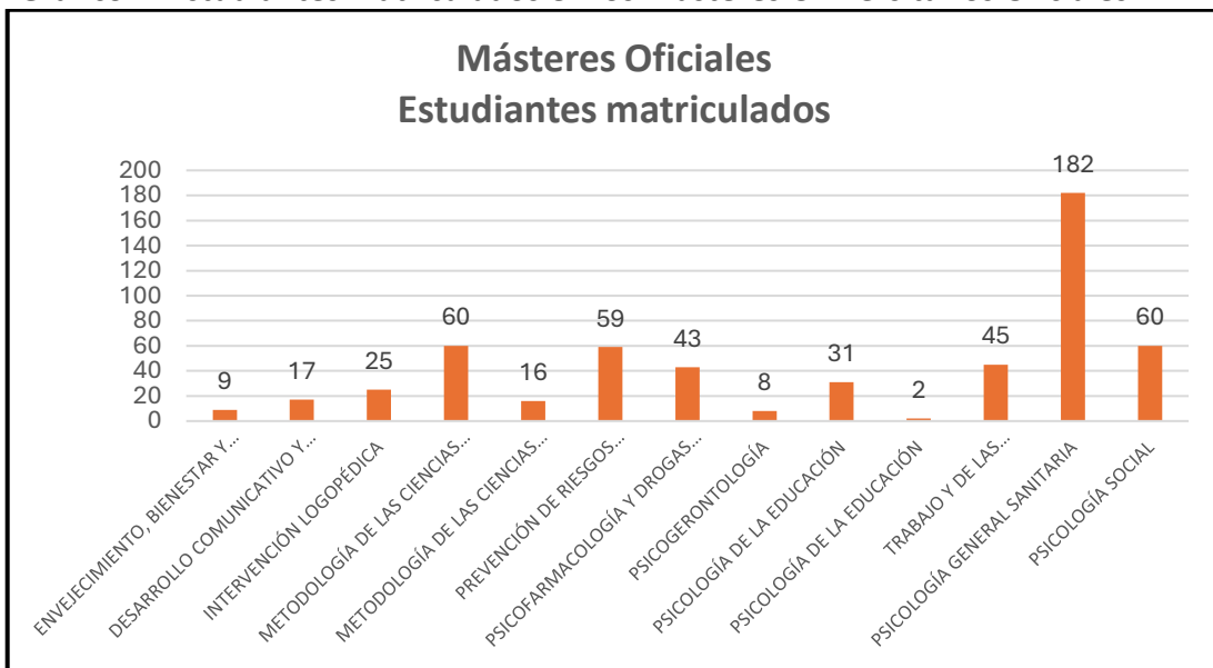
Gráfico 2. Estudiantes matriculados en los Másteres Universitarios Oficiales