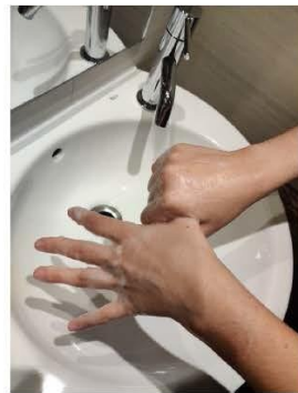
el pulgar con la palma de la mano, rotando,