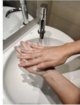
Frota las palmas entre sí,