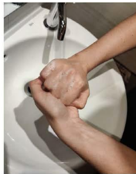
el dorso de los dedos con la palma opuesta, agarrando los dedos,