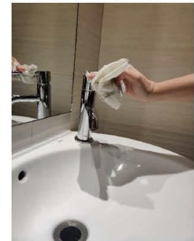
utilízala para cerrar el grifo y tírala a la basura.