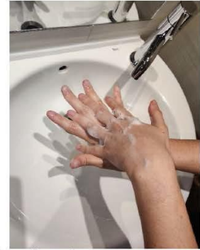
la palma de una mano contra el dorso de la otra, entrelazando los dedos y viceversa,