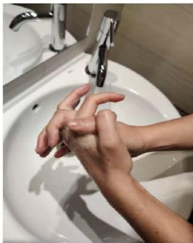
las palmas entre sí, con los dedos entrelazados,