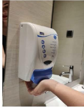
Deposita suficiente jabón en las palmas.