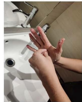
la punta de los dedos contra la palma, rotando,