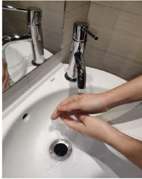
Mójate las manos.