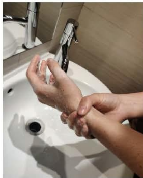
y continua lavando las muñecas.