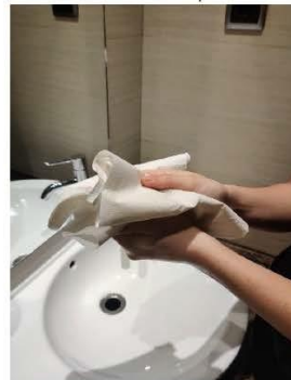
Sécate con una toalla desechable,